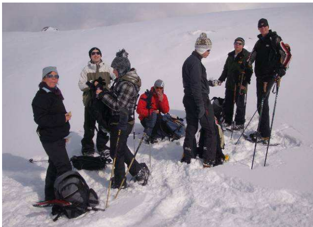
Gipfelstürmer bei der Rast

Das Mittagessen hatten wir uns alle redlich verdient. À la carte durften wir auswählen zwischen „Sunnbühler Rösti“ oder „Schwarzenbach Makkaronen“ und anderen Köstlichkeiten.