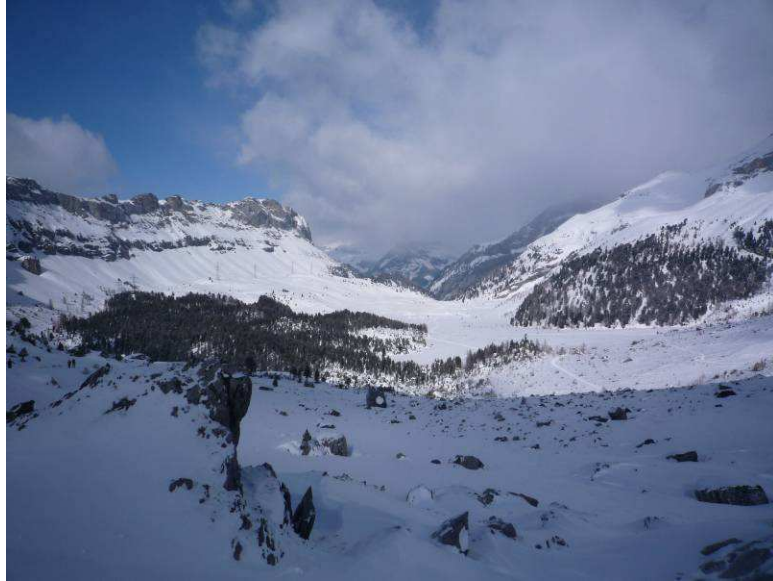
Die wärmende Sonne naht und die Aussicht ist grandios