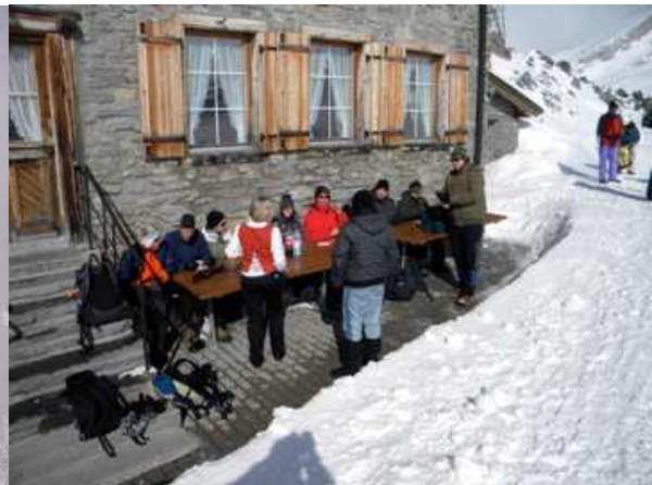
Gemütliches Beisammensitzen in der Kälte

Danach hatte jemand die glorreiche Idee, den Kaffee an der warmen Sonne zu geniessen. Dies führte bei einigen Teilnehmern, aufgrund der eisigen Kälte und strengen Bise, zu einiger gehörigen Unterkühlung. Deshalb waren für einmal alle froh, als der erneute Aufbruch angekündigt wurde.